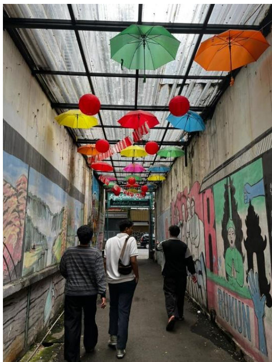
Gambar 2. Gang Kampung Toleransi Paledang