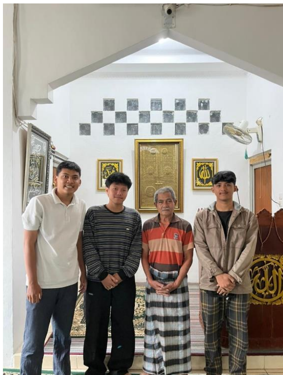
Gambar 3. Wawancara dengan Narasumber di Lingkungan Masjid Paledang