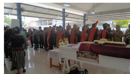
Gambar 3. Saur Matua

Saur Matua ( saur = sempurna/lengkap, matua =) adalah upacara adat kematian dalam budaya Batak Toba, yang ditujukan bagi seseorang yang meninggal di usia tua. Kriteria utamanya adalah mendiang telah memiliki cucu dari seluruh anaknya. Sehingga kematiannya dirayakan sebagai bentuk penghormatan dan rasa syukur,