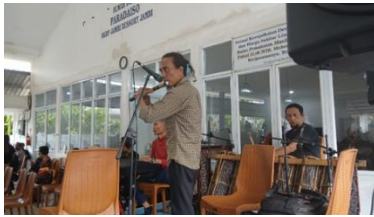
Gambar 4. Gondang