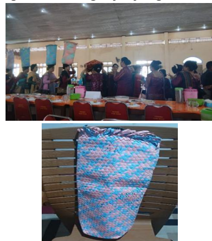
Gambar 2. Tandok di Acara Adat.

Tandok adalah wadah tradisional khas suku Batak yang terbuat dari anyaman daun pandan atau bahan lain, digunakan untuk menyimpan atau membawa beras dalam acara adat seperti pernikahan dan upacara keagamaan. Tandok melambangkan kesejahteraan, kesuburan, dan keberlimpahan, sering dijunjung di atas kepala.