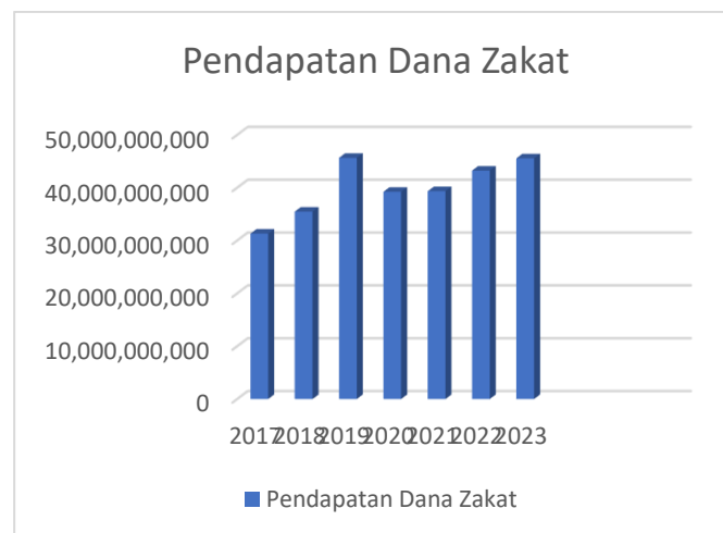
Gambar 1. Grafik Pendapatan Dana Zakat di LAZ BMH Tahun 2017-2023