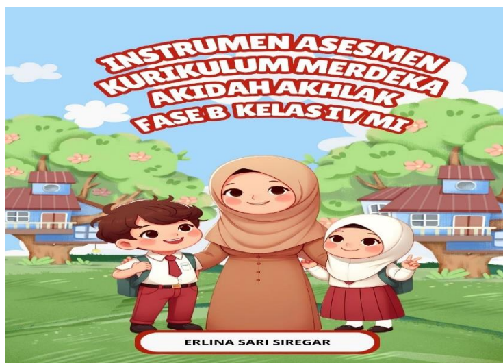
Gambar 1: Tampilan Cover Bank Soal Akidah Akhlak Kelas IV MI

Tampilan depan atau cover buku memiliki daya tarik tersendiri bagi orang yang hendak membaca, maka pemilihan gambar dan bentuk desain cover buku memiliki peran penting dalam menarik minat pembaca. Desain cover pada buku bank soal akidah akhlak ini dikembangkan dengan memanfaatkan web canva dan selanjutnya format yang dipilih didesain sesuai dengan kebutuhan peneliti. Untuk lebih detailnya dapat dilihat berikut ini.