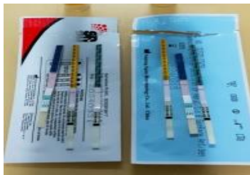
Gambar 4.1 Gambar Hasil Skrining Anti-HCV

Pada tabel 4.2 , dari kode sampel 1-10 menunjukkan hasil negatif, yang menandakan bahwa tidak terdeteksi adanya antibodi HCV pada sampel. Dari seluruh sampel, tidak terdapat hasil positif, yang menandakan adanya antibodi HCV dalam sampel pasien. Ini dapat dilihat secara jelas dalam bentuk gambar yaitu pada gambar 4.1 .