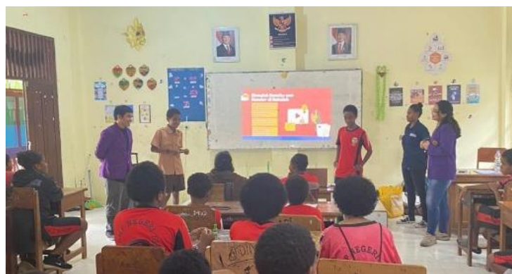
Gambar 1 Kegiatan Penyuluhan Kesetaraan Gender di Lingkungan Sekolah

Kegiatan diawali dengan penyuluhan yang menjelaskan tentang pengertian gender, perbedaan gender dan seks, isu ketidaksetaraan, serta dampak diskriminasi. Sesi brainstorming dilakukan untuk menggali persepsi siswa melalui kelompok diskusi dan analisis gambar mengenai peran laki-laki dan perempuan dalam kehidupan sehari-hari. Kegiatan ini dilakukan dengan pemaparan materi oleh fasilitator (Gambar 1), dimana fasilitator menjelaskan secara langsung apa itu gender, Perbedaan gender, seks dan seksualitas, masalah kesetaraan gender di sekolah, penyebab kesetaraan gender, dampak ketidaksetaraan gender, dan cara mengatasi ketidaksetaraan gender.