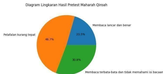
Gambar I Diagram lingkaran

Berikut merupakan diagram lingkaran hasil pretest maharah qiroah :